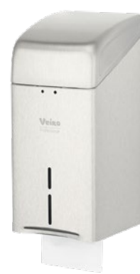
VEIRO L-ONE STEEL

Листовая туалетная бумага V-сложения широко применяется в общественных и индивидуальных туалетных комнатах номерного фонда объектов гостеприимства, ресторанах, Офисных и Административных зданий, Медицинских учреждений.