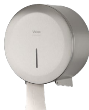
VEIRO JUMBO STEEL

Широко применяется в местах общественной гигиены с высокой и средней проходимостью в Офисных и Административных зданиях, заведениях сегмента HoReCa, Медицинских учреждениях, на объектах Транспорта, Спортивных объектах.