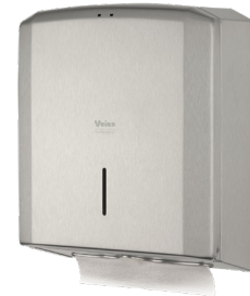
VEIRO PRIMA STEEL

Бумажные полотенца Z-сложения широко применяются в общественных туалетных комнатах Офисных и Административных зданий, Торгово-развлекательных центров, заведениях сегмента HoReCa, на объектах Транспорта, а также в смотровых кабинетах Медицинских и косметологических учреждений. Диспенсеры Veiro Prima, Veiro Prima mini и Veiro Prima Steel гарантируют экономичность использования листовых бумажных полотенец, благодаря полистовой системе подачи. Средний расход 1-2 листа. Большая вместимость (500-600 листов) позволяет сокращать периодичность обслуживания. Диспенсерные системы предотвращают контакт с внешней средой и обеспечивают максимальную гигиеничность применения бумажной продукции и полное отсутствие перекрёстного загрязнения.