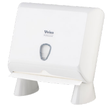
VEIRO PRIMA MINI